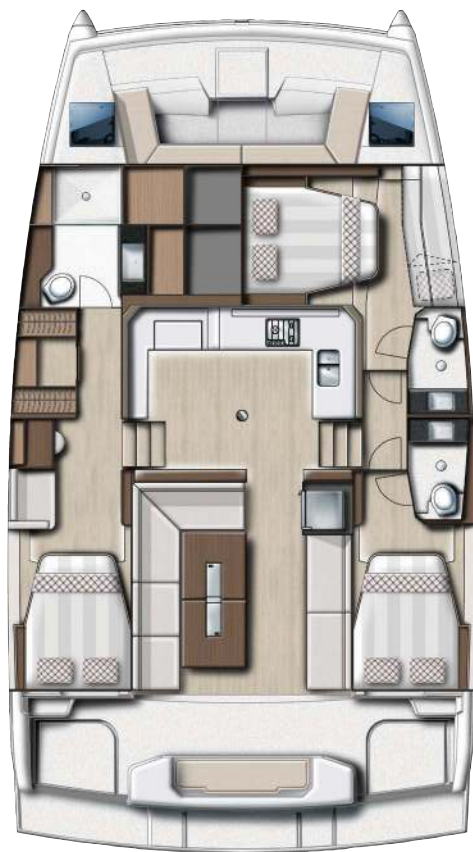
3 cabins Owner's version Version 3 cabines propriétaire