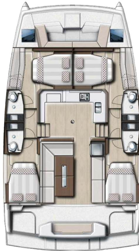
4 cabins family version Version 4 cabines famille