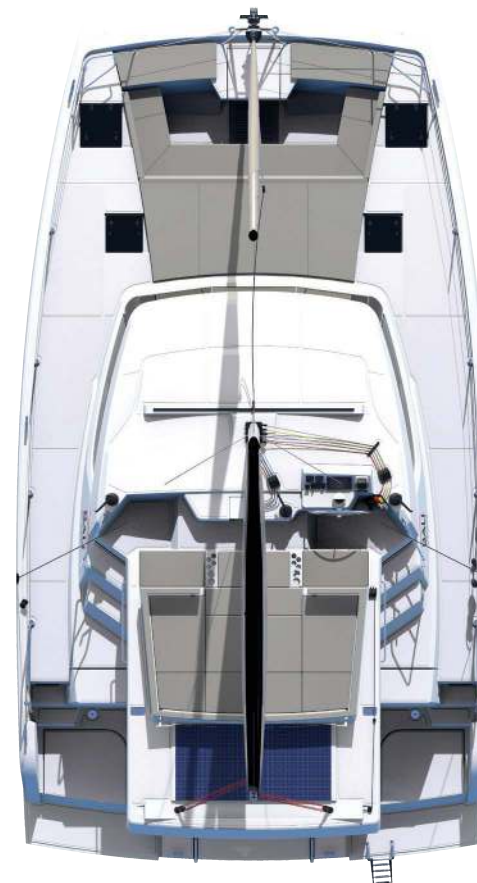
Deck and Flybridge Pont et flybridge