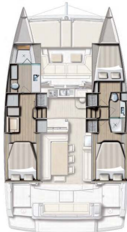
3 CABINS / 2 HEADS VERSION VERSION 3 CABINES / 2 SDB