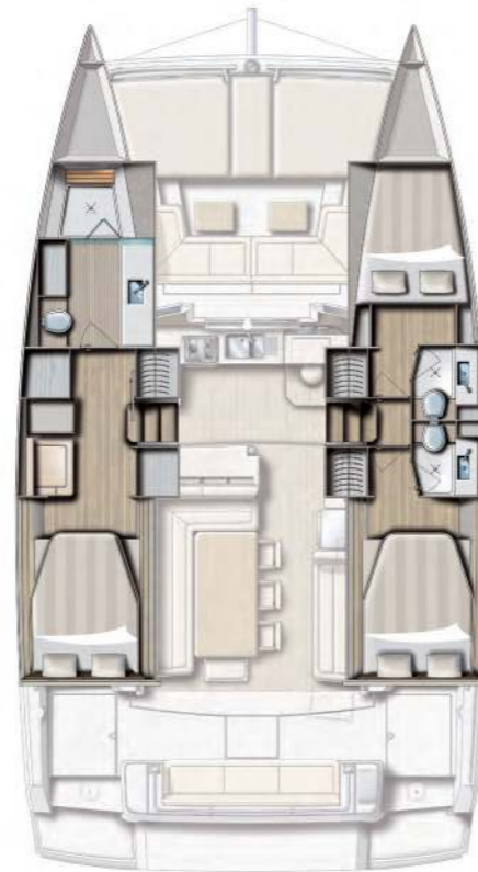
3 CABINS / 3 HEADS VERSION VERSION 3 CABINES / 3 SDB