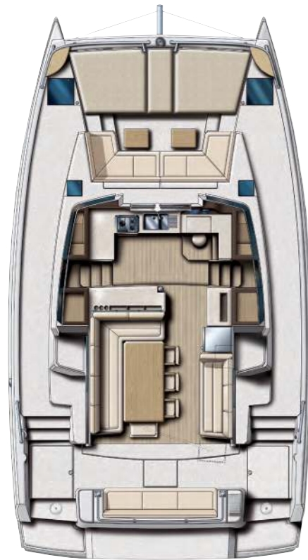
COCKPITS AND SALOON COCKPITS & SALON

INTERIORS AND LAYOUTS TO SUIT YOUR REQUIREMENTS / DES INTERIEURS QUI VOUS RESSEMBLENT